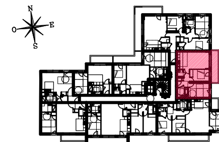
RUE LAURENT GAUDET